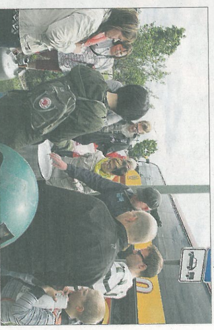
Jossain Wienin ja Budapestin välillä pysähdyttiin ruokailemaan.